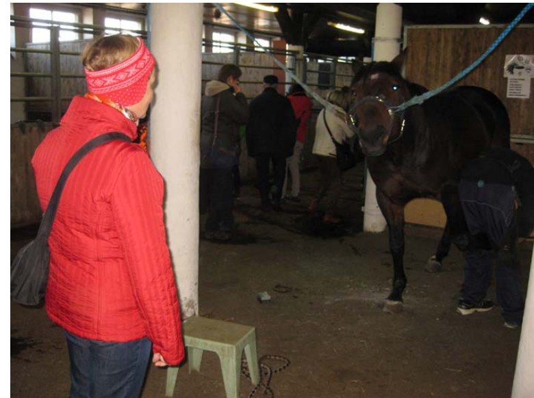
Ilkan valmennustallissa päästiin seuraamaan kengitystä.