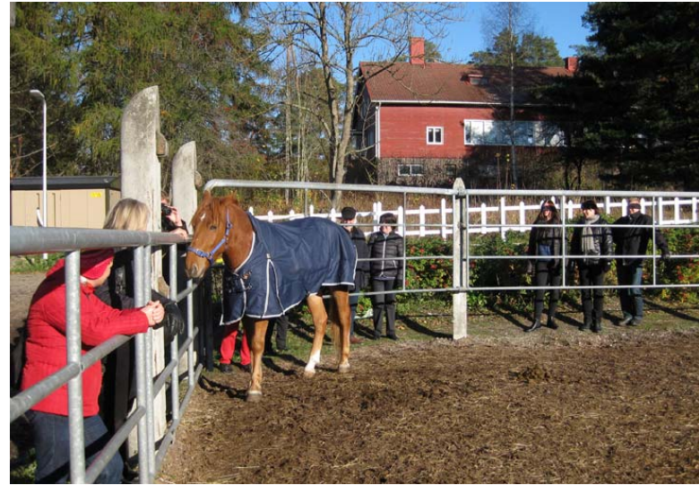
R. R. Nykäisy tervehtii omistajiaan kotitallinsa pihassa.