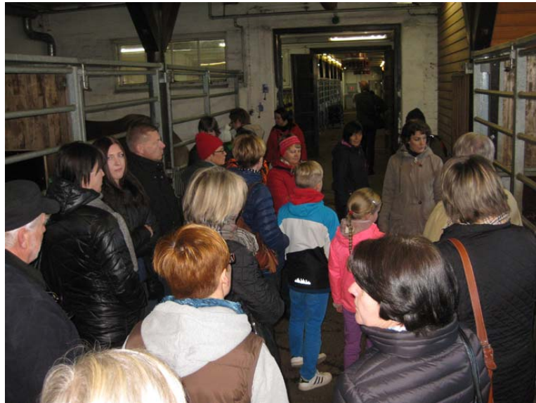
Tallikierroksella tutustuttiin Hevosopiston ja MTT:n kasvattamiin suomenhevosiiin.